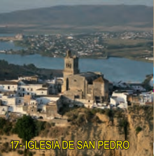
17- IGLESIA DE SAN PEDRO