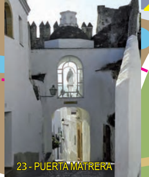
23- PUERTA MATRERA