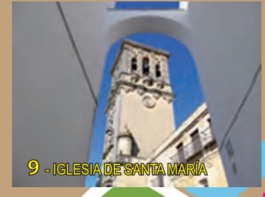
9- IGLESIA DE SANTA MARÍA