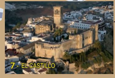
7- EL CASTILLO