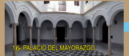
16- PALACIO DEL MAYORAZGO