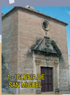
1- IGLESIA DE SAN MIGUEL